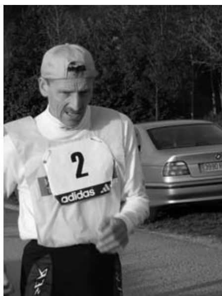
KLAPA franchit le mur des 20h au 200km en améliorant au passage la Meilleure Performance Mondiale du 100km