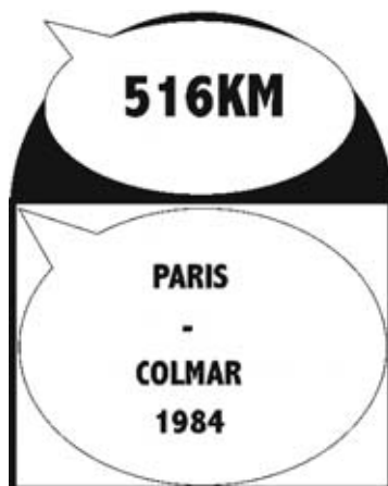
38 ème édition du 6 au 9 juin 1984

Citation de Jean-Claude GOUVENAUX servant de titre au très beau roman de Yves-Michel KERLAU, publié aux éditions Persée.