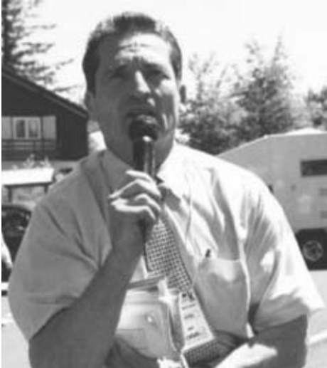
Directeur-adjoint de Paris-Colmar et speaker

100km route : 9h44'19" 200km route : 20h56'22" - 24h route : 212km354